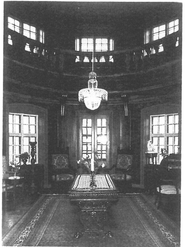
Runda Salongen, Helgerums Slott