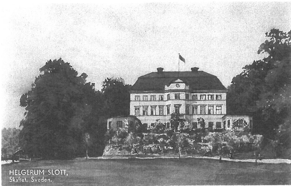
HELGERUM SLOTT, Skåtet, Sweden.