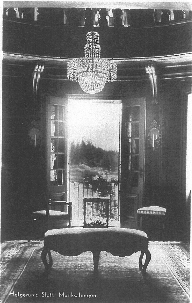
Helgerums Slott. Musiksalongen.