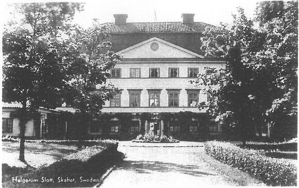
Helgerum Slott, Skaflet, Sweden.