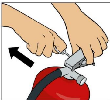
Dra ut säkringen.