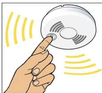
Testa brandvarnaren varje månad genom att trycka på testknappen.