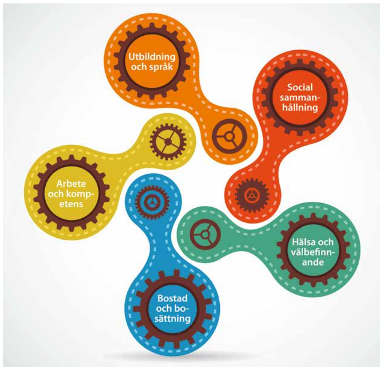
Integrationsstrategins fem strategiska fokusområden.

Vid prövning av barnets bästa är det viktigt att verksamheter lyssnar och tar hänsyn till barnets egna åsikter. Enligt FN:s barnkonvention är barns rättigheter desamma oavsett legal status.