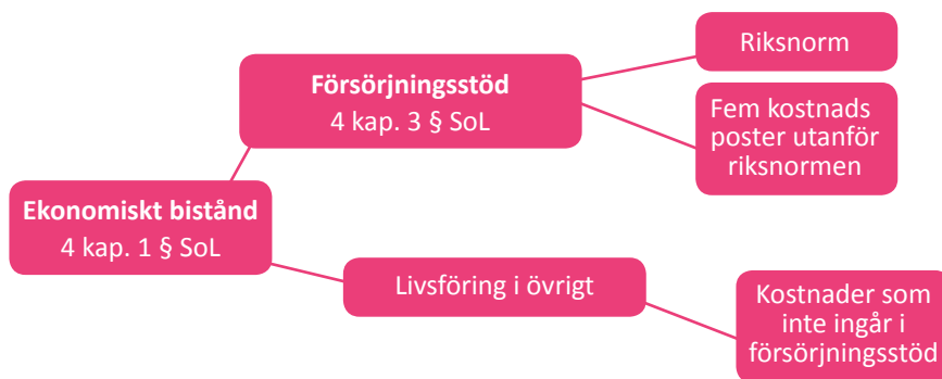
Figur 2. Förklaringsmodell av ekonomiskt bistånd.

Vid en ansökan om ekonomiskt bistånd, som sker månatligen, sker initialt ett ”nybesök” vars information ligger till grund för en utredning som alltid ska göras per ärende. Denna utredning ligger sedan till grund för beslut om rätt eller inte rätt till ekonomiskt bistånd i framtiden. Den ska inkludera underlag för att kunna utreda om det finns ett behov av försörjningsstöd, samt huruvida rätt till det föreligger. Försörjningsstöd är uppdelat enligt Figur 2.