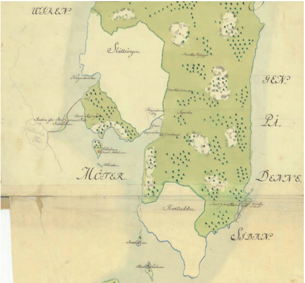
Figur 3: Historisk karta 1750