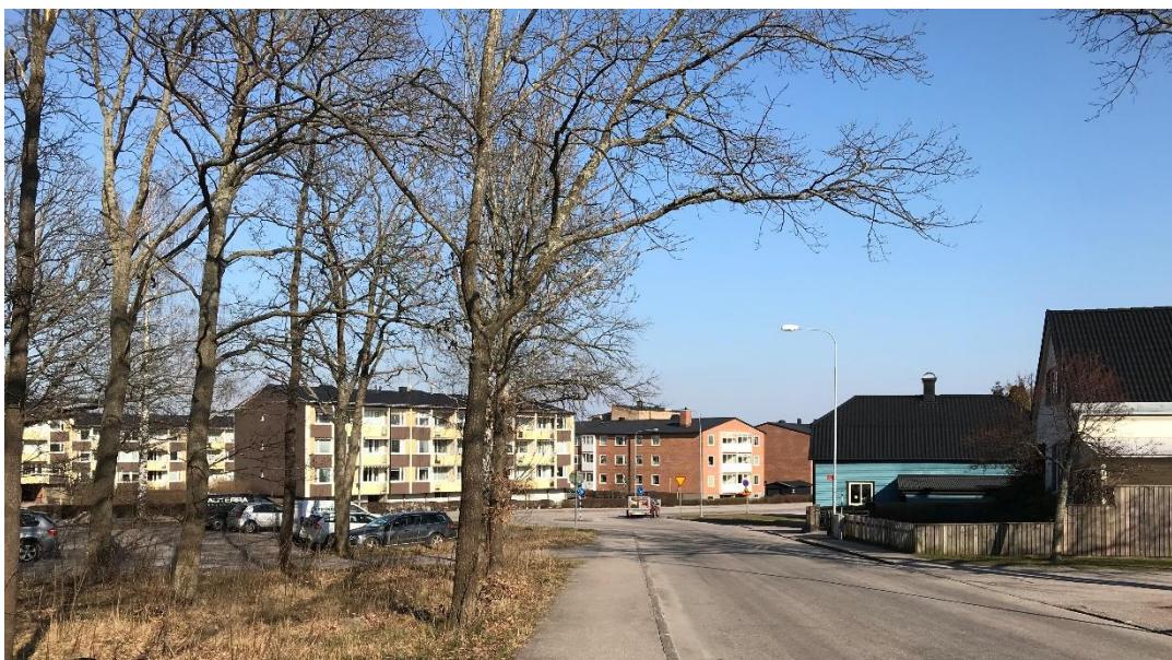
Planområdet till höger i bild, villabebyggelse och flerbostadshus i angränsande kvarter.