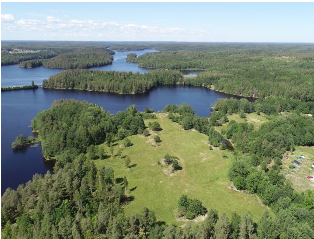
Flygfoto över tänkt planområde.

En ny detaljplan innebär att ytor av gammal åkermark som idag används för bete kommer att ianspråkta för en utbyggnad av bostadsändamål. I kommunens översiktsplan (ÖP 2025 Bebyggelse på landsbygd, 2014-11-07) är området utpekade som ett LIS- område för bostäder. Enheten för samhällsbyggnad beräknar att mellan 10-20 nya tomter kan tillskapas. Området ligger ca 1.6 kilometer från centrala Ankarsrum och