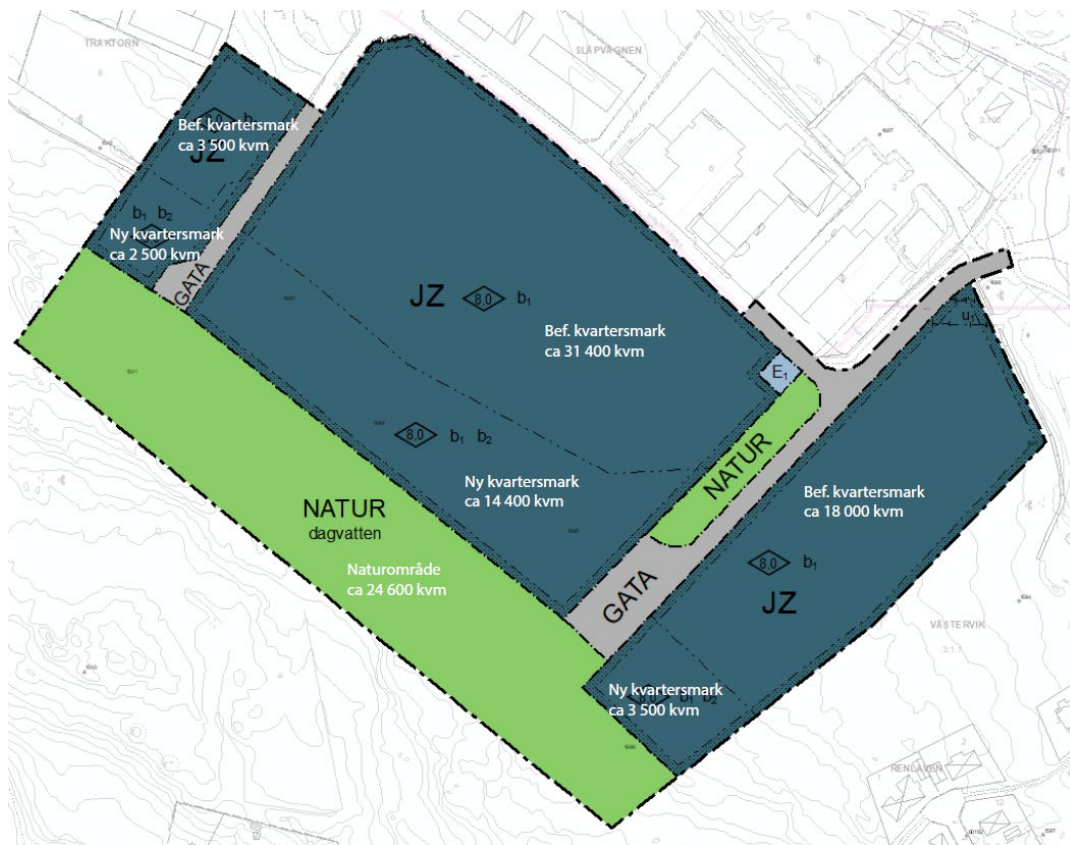
FIGUR 2: Areal över olika markanvändningar.